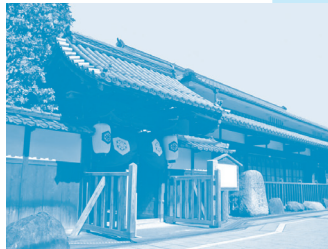
郡山宿本陣(椿の本陣) 大名や公家などが宿泊・休憩する西国街道の宿駅。 ※大阪北部地震の影響により、現在公開を中止しております。