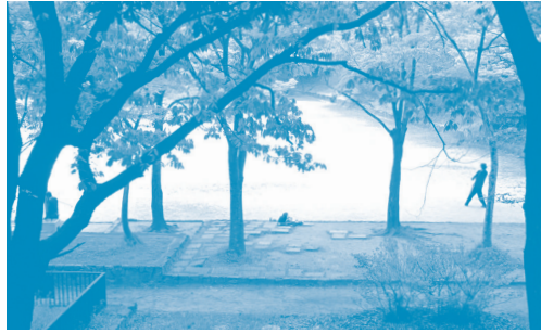
郡山公園 豊かな樹林で特に秋の紅葉が楽しめます。