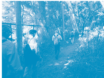
ゴルフ場 横(緑道) 大阪にはじめて設立されたゴルフ倶楽部のコースに沿って、森林浴。